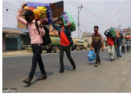
Zu Fuß auf dem Weg in die Heimatdörfer

Sehr erschrocken machen uns Nachrichten, die wir aus Dörfern in Nepal erhalten. Zehntausende haben das Kathmandu Tal verlassen und sind in ihre Heimatdörfer geflüchtet in der Hoffnung, dort besser überleben zu können, nachdem sie ihre Arbeit und Einnahmequelle durch den Lockdown verloren haben. Für viele sind die Zukunftsaussichten mehr als düster, hier geht es um existentielle Sorgen, fehlt es in Nepal doch an einem sozialen Netz, das wie bei uns den Sturz ins Bodenlose verhindert.