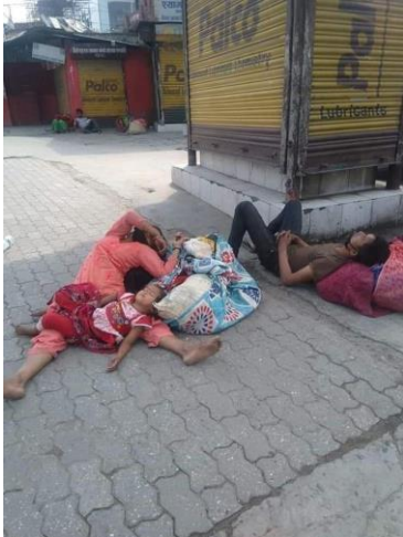
Verzweiflung in Kathmandu

In Bolde wohnen im Augenblick 40% mehr Menschen, ohne Aussicht, dass sich die Verhältnisse in absehbarer Zeit bessern. Hunger und Not sind die unausweichlichen Folgen dieser Situation. Die Erträge der kargen Felder reichen bei Weitem nicht, um alle zu ernähren, Rücklagen haben die wenigsten Familien.