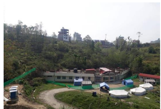
Corona Isolationsbereich im DHOS

Das Dhulikhel Hospital mit einem Einzugsgebiet von 2,3 Millionen Menschen wurde von der Regierung als eines von 18 Corona Zentren bestimmt, eine riesige Verantwortung und Herausforderung. Es wurde ein Krisenteam gebildet, sowohl im medizinischen als auch im administrativen Bereich, um schnell und koordiniert reagieren zu können. Ein Beratungsteam mit Ärzten der Namaste-Stiftung, der Gastrofoundation und GRVD, die schon im Dhulikhel Hospital ehrenamtlich und lehrend gearbeitet haben, unterstützt das DHOS mit seiner Expertise.